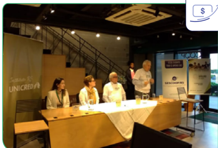
Criado pela Unicred Ponto Capital, projeto prevê capacitar pessoas de baixa renda residentes em periferias da cidade de Santa Maria, por meio da oferta de cursos que tratam da Economia Circular.