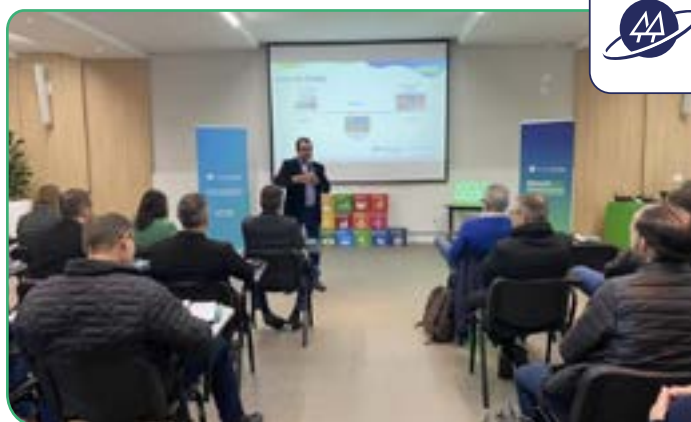
Evento contou com a participação de 42 representantes das cooperativas da região.