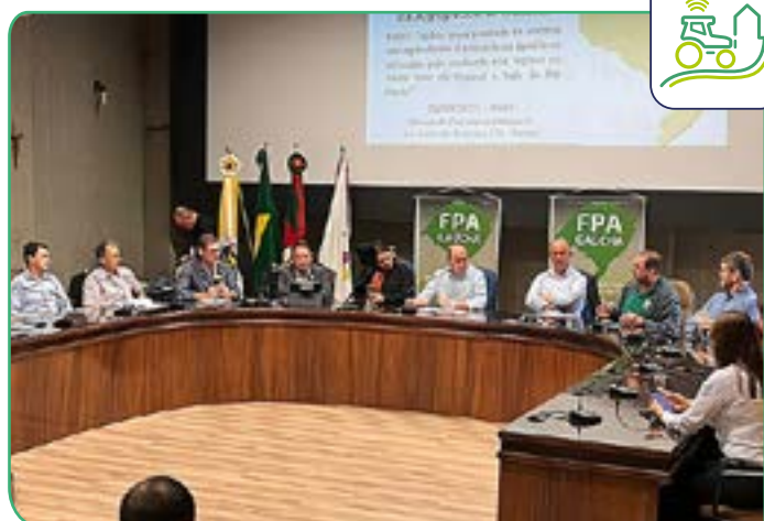
Fortalecimento da Representação Institucional é um dos projetos que integra o Programa RSCOOP150bi.