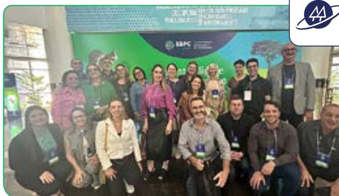
Encontro Brasileiro de Pesquisadores em Cooperativismo ocorreu em Brasília (DF).