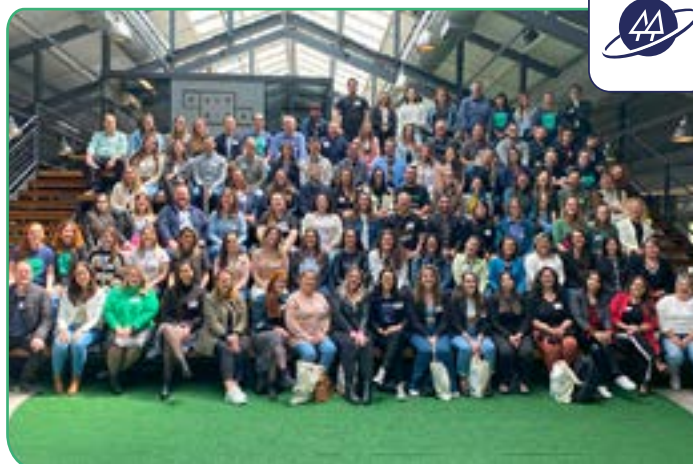
Evento reuniu mais de 100 profissionais da área que atuam em cooperativas de diversos ramos.