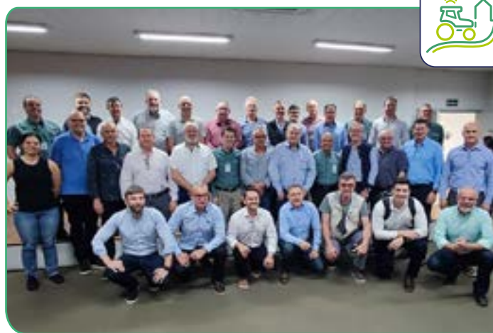
Encontro foi realizado no município de Maringá (PR).