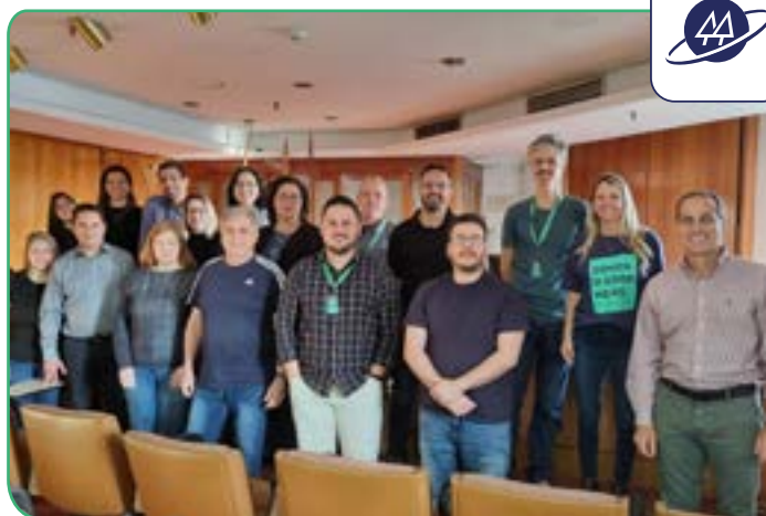
Capacitação visa atualização dos colaboradores do Sistema Ocergs quanto à fase de planejamento das contratações, de acordo com a nova lei de licitações.